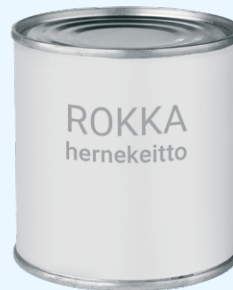
Kuva tuote- pakkauksesta

Yllä mainittujen erien pakkauksen kannen "easy open" -saumassa on laatuvirhe, joka saattaa aiheuttaa tuotteen pilaantumisen. Pilaantunut tuote voi olla terveydelle vaarallinen. Muita eriä voi myydä normaalisti.